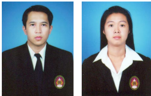
ระดับประกาศนียบัตร (ใช้สูทและเนคไทสีดำเท่านั้น)